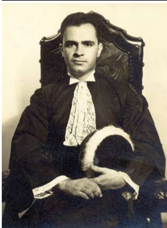
Formatura no curso de Direito na Faculdade Nacional de Direito em 1955

“Como era bom aluno, um professor sugeriu que eu fizesse o Artigo 91. Funcionava assim: você se preparava para fazer a prova no Colégio Pedro II. Se passasse, ganhava o diploma do ginásio e podia fazer o científico. Depois de um ano de aulas na Associação Cristã de Moços (ACM), fui aprovado”